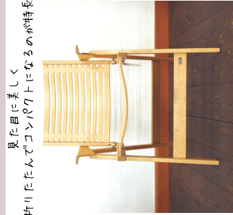
REX Folding Chair/REX KRALJ