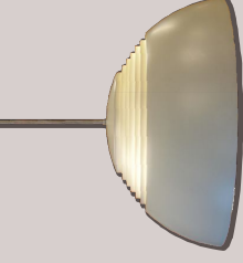
AJ Royal 500/Louis poulsen