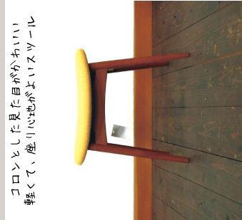
MI スツール/家具工房Ridgeline

ツパメの羽を想わせる織りかかライン 大きめに設定した座面は腰掛けやすく、 座り続けても疲れないように配慮されています