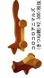
コロコロニマルズ (きつね観) ¥2,300(税抜) コロコロニマルズ(ペンギン) ¥1,800(税抜)