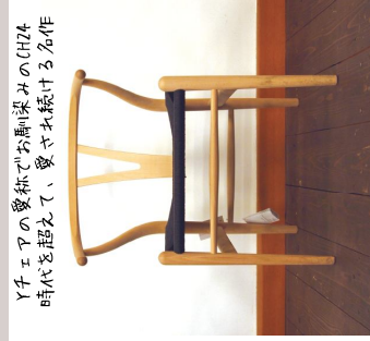
GH24/Carl Hansen & Son