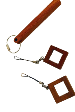
キーホルダーhitoe ¥800(税抜) めもりキーホルダー ¥1,400(税抜)