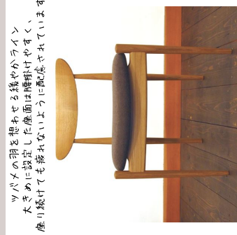
Smallowチェア/オーグビレッジ

ツパメの羽を想わせる織りかかライン 大きめに設定した座面は腰掛けやすく、 座り続けても疲れないように配慮されています