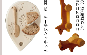
カッチェンボード ¥3,000(税抜)