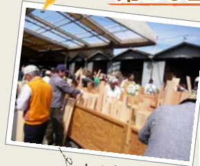
大人気! 木材の販売

全国から集められた銘木や一枚板から 親子で楽しむ木工教室に家づくりのご相談まで。 木の情報がたくさん詰まったクラモクへ 遊びに行こう! 屋台もいっぱい来るよー!!