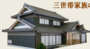
※9月末開催予定でしたが 変更となりました。

自由設計 FREE STYLE 倉敷市新田 延床面積183.75㎡ (55.58坪)