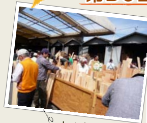
大人気! 木材の販売

全国から集められた銘木や一枚板から 親子で楽しむ木工教室に家づくりのご相談まで。 木の情報がたくさん詰まったクラモクへ 遊びに行こう! 屋台もいっぱい来るよー!!