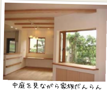
中庭を見ながら家族だんらん

中庭を取り囲むように配置されたリビングダイニングでは子どもたちが元気に走りまわったり、勉強やお絵かきしたり、ご主人の趣味の熱帯魚スペースなどがあり、家族が思い思いに過ごせる工夫がいっぱいです。キッチンの奥にはゆったりとした家事コーナーも。家族が楽しく過ごせる住まいです。