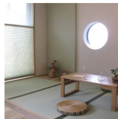
↑土間から入れる畳コーナー