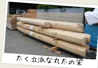
たく立派な丸太の梁

クラモクでも久しぶりの和風本家普請の家がいよいよこの夏、完成します。三間続きの和室はもちろん、三世帯のご家族がゆったり暮らせるLDKなど、見応え十分なお家です。