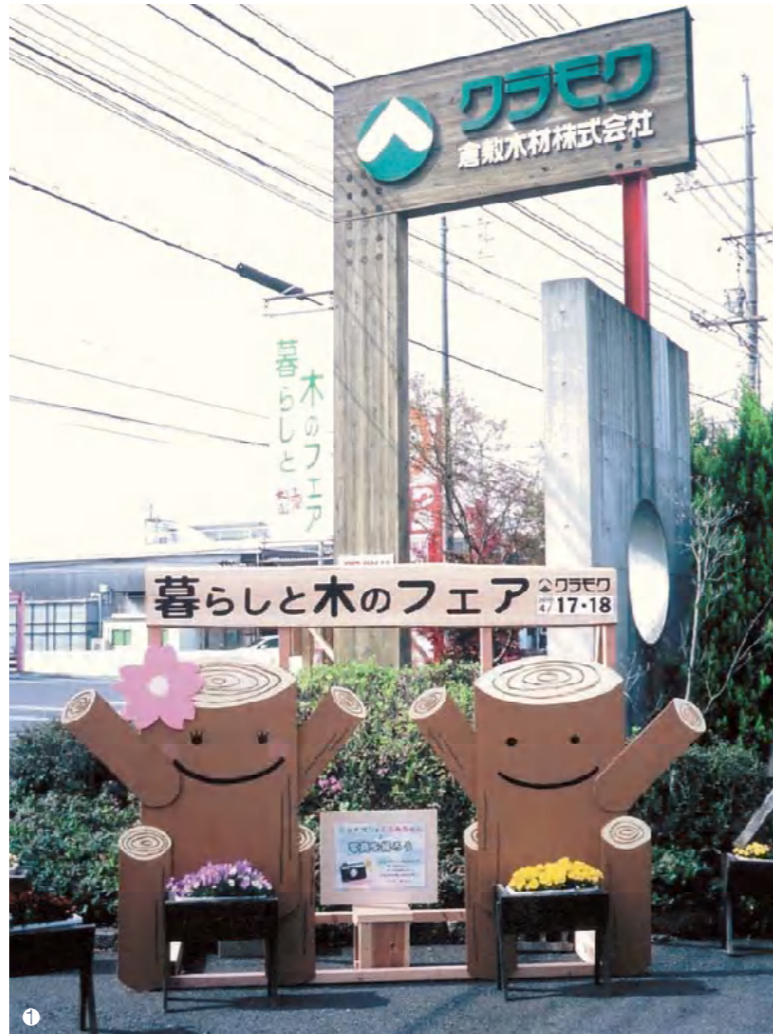
① ジョナサン&くるみちゃんと写真撮影出来るパネルが登場。 ② 木でできたオリジナルキャラクターの「ジョナサン」と「くるみちゃん」がいっぱい。 ③ 一枚板など、材木屋ならではの木も販売しています。 ④ 木材だけでなく、ブロックなどのエクステリア商品も格安で販売していました。 ⑤ 杉や桧などの無垢材も破格値で販売されていました。 ⑥ カリンやクリの材を削って作る自分だけの箸。ご飯を食べるのが楽しみになりそう。